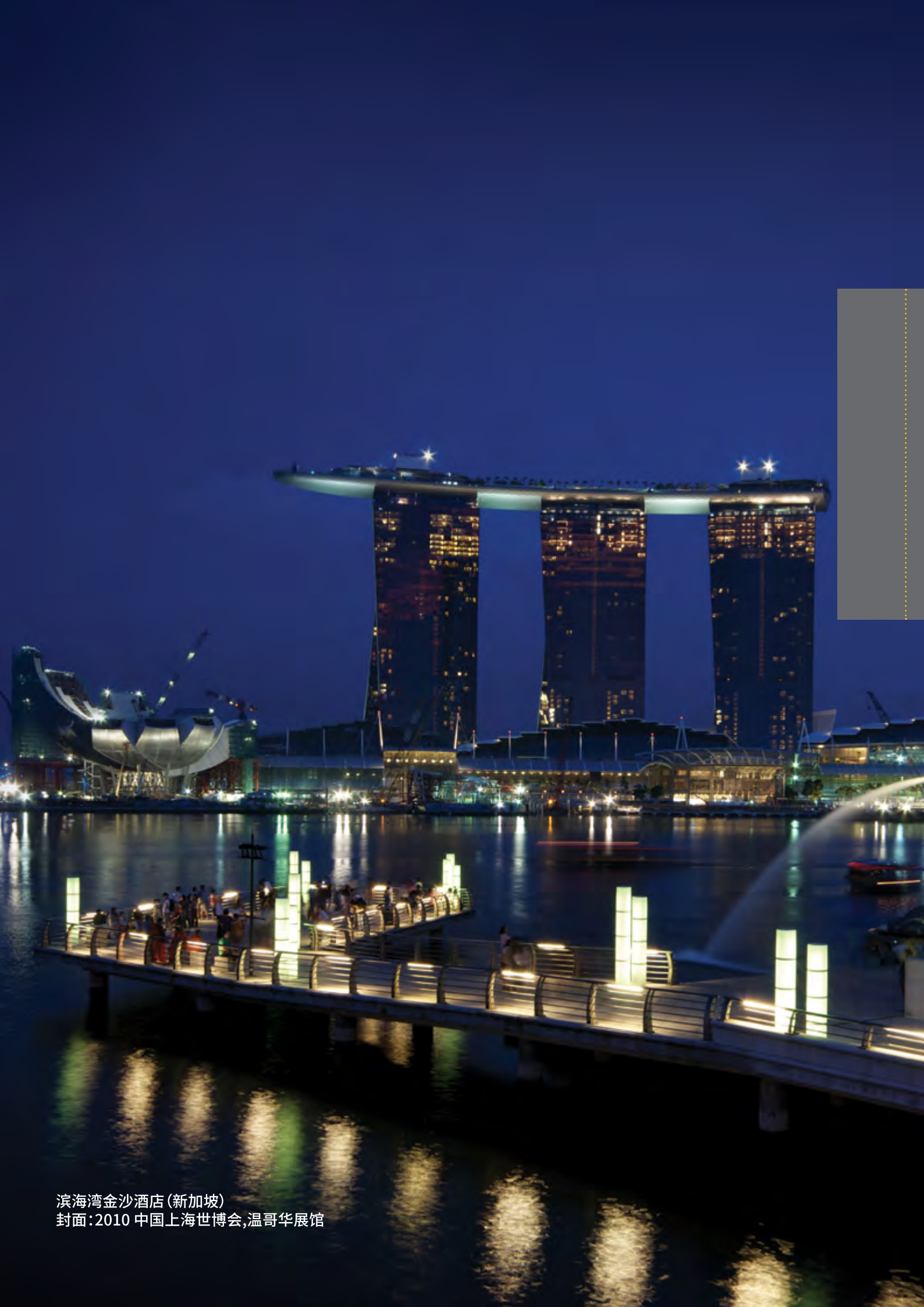
滨海湾金沙酒店(新加坡) 封面:2010 中国上海世博会,温哥华展馆