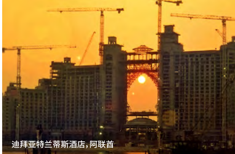
迪拜亚特兰蒂斯酒店, 阿联酋