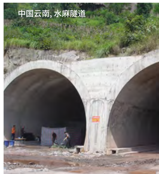
中国云南, 水麻隧道