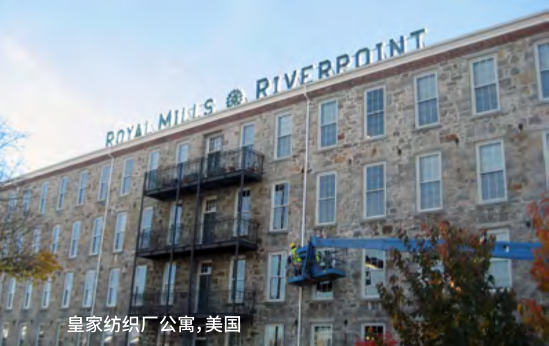
皇家纺织厂公寓, 美国